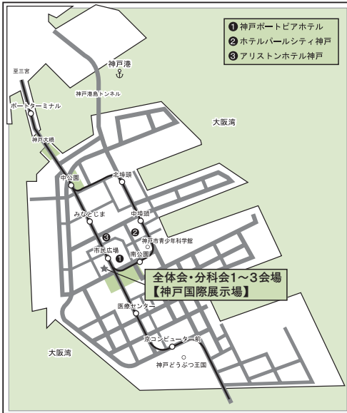
ポートアイランド