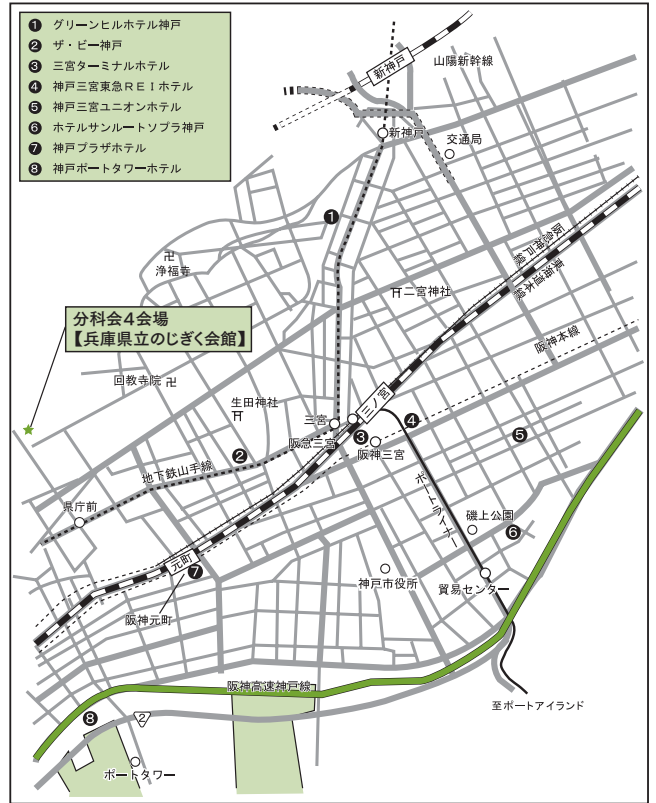
三ノ宮・元町周辺